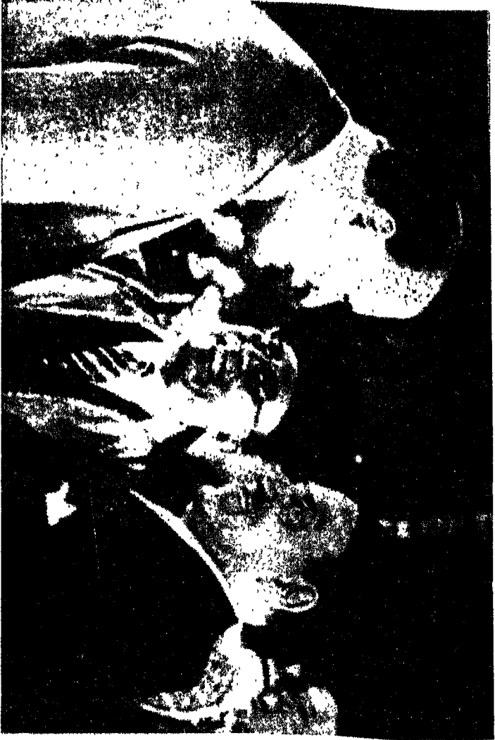
النحاس باشا - الهلالي باشا - السفير البريطاني